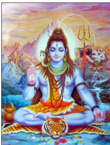
Бог Шива, първият Учител

Омни предлага по-мощни символи от всички други Рейки системи, съществуващи по света. С помощта на Омни символите лечебният ефект се постига значително по-бързо. Омни системата работи ефикасно на всички нива – физическо, умствено, психологическо, емоционално, духовно, а също и върху аурата и кармата.