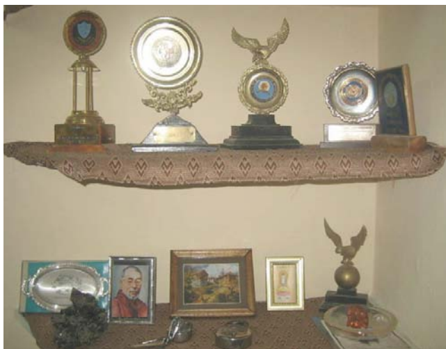
Част от наградите на д-р Самир Кале

между хората. Вече има над 36 000 практикуващи по света. За своята широкомащабна дейност като целител и учител по медитация, д-р Кале е носител на много национални и международни награди.